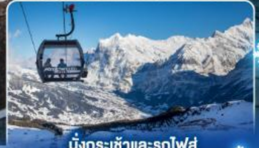
นั่งกระเช้าและรถไฟสู่ ยอดเขาจุงเฟรา