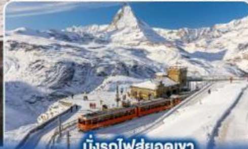
นั่งรถไฟสู่ยอดเขา กรอนเนอร์เกรต