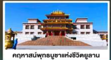
คฤหาสน์พุทธบูชาแห่งชีวีตยูลาน