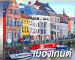
เมืองกันต์