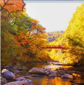
“JOZANKEI FUTAMI BRIDGE”