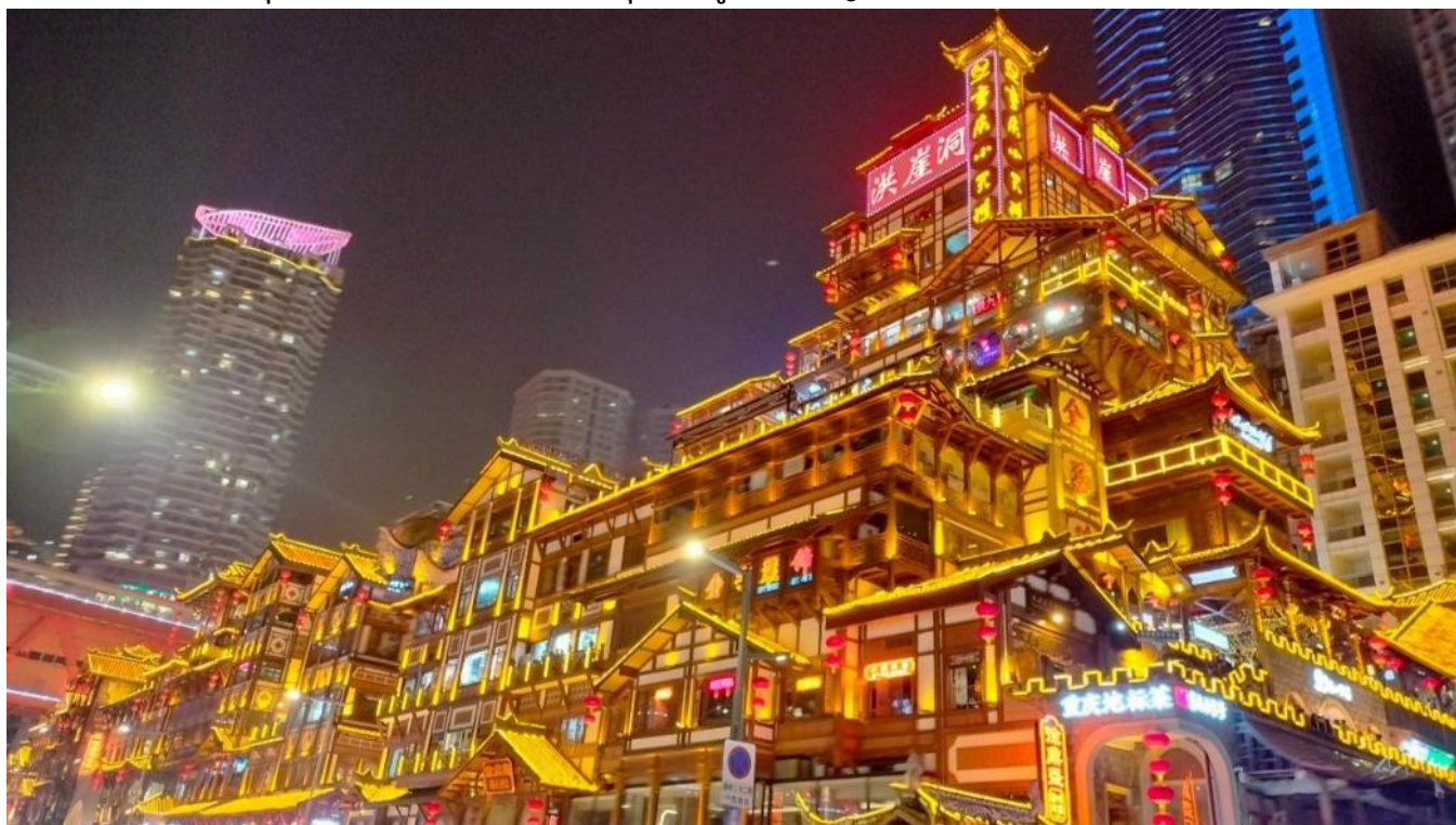
ที่พัก HOLIDAY INN SUITES CHONGQING JINHUI หรือระดับเทียบเท่า 4 ดาว

นำท่านชมความงดงามยามค่ำคืน หงหยาดัง คอมเพล็กซ์ในรูปแบบทรงอาคารโบราณขนาดใหญ่ ภายในมีร้านค้า ร้านอาหาร ร้านขายสินค้าที่ระลึก ฯลฯ ที่นี่ถือเป็นจุดนัดพบพักผ่อนของชาวเมือง และจุดชมวิวยอดเยี่ยม อีกทั้งยังเป็นจุดถ่ายรูปที่สำคัญของนักท่องเที่ยวอีกด้วย