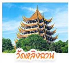
วัดเลิ่งฉวน