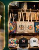
ของฝากเก๋ ๆ