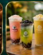
เครื่องดื่มยอดนิยม