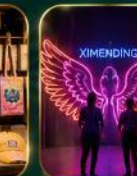
จุดเช็คอินสุดฮิต