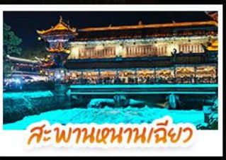
สะพานเทียนเฉียว