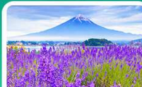
สวนโออิชิปาร์ก