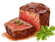
● ไส้ทานเนื้อวัว

ขอความกรุณาแจ้งวัตถุประสงค์ที่ท่าน แพ้หรือไม่สามารถรับประทานได้