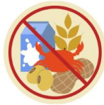
● แพ้อาหาร / อื่นๆโปรดระบุ