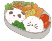
● อาหารสำหรับเด็ก ( 2-11 ปี ) *วัตถุประสงค์ขึ้นอยู่กับทาว์ราน