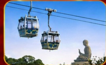
กระเช้านองปิง