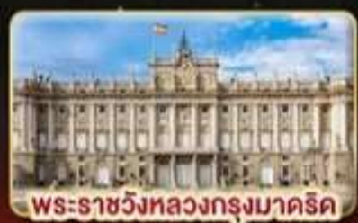
พระราชวังหลวงกรุงมาดริด