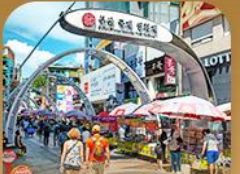
ตลาดนัมโพดง