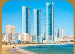
หาดแฮอินแด