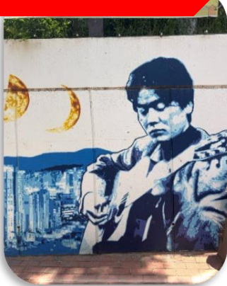
ถนนคิมควังซอก

นำท่านเที่ยวชม ถนนคิมควังซอก เป็นถนนสายเล็ก ๆ สดอบอุ้นในเมืองแทกู ที่สร้างขึ้นเพื่อระลึกถึง คิมควังซอก นักร้องโฟล์กในตำนานของเกาหลีใต้ ผู้เกิดที่แทกูและเป็นศิลปินที่คนเกาหลียังคงรักมากจนถึงทุกวันนี้ เดิมทีบริเวณนี้เป็นกำแพงเก่าใต้ทางรถไฟ แต่ภายหลังถูกพัฒนาให้กลายเป็น "ถนนแห่งเสียงเพลงและความทรงจำ" ตลอดทางจะเต็มไปด้วยภาพวาดกราฟฟิตี้ รูปปั้นของคิมควังซอก งานศิลปะและมุมถ่ายรูปแนววินเทจ เส้นห์ของถนนนี้ไม่ใช่ความอลังการ แต่เป็นความรู้สึก "อบอุ่นและมีเรื่องราว" คาเฟ่ ร้านดนตรี และบรรยากาศย้อนยุค