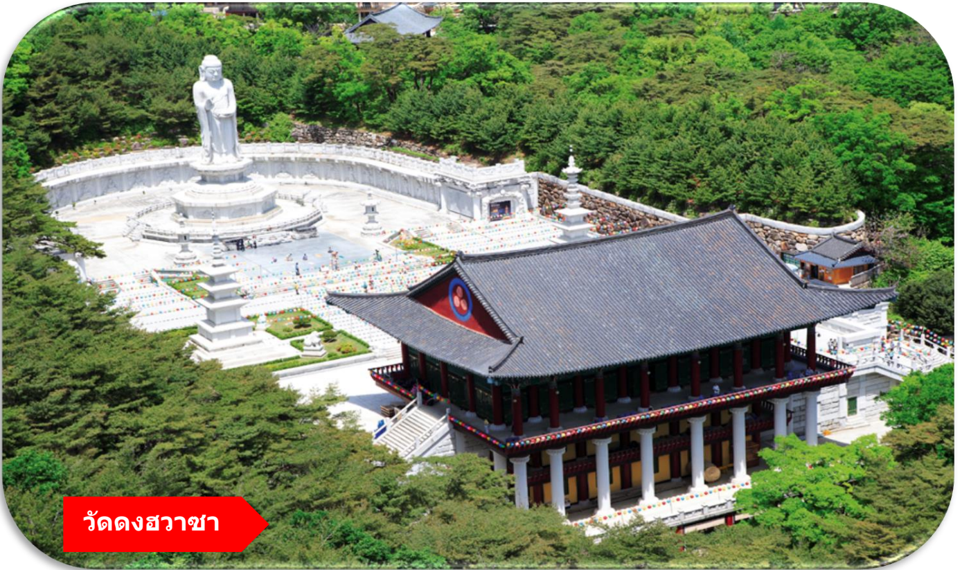
วัดดงสวาชา