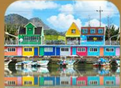
ท่าเรือจิ้งนิม