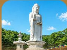
วัดดงซาซา

เปิดประสบการณ์เที่ยวเกาหลีสุดคุ้ม ปีครั้งเดียว เที่ยวสองเมือง • เช็กอินถนนนักร้องคิมคยองฮอก สัมผัสเสน่ห์ศิลปะและเสียงเพลง • นั่งรถไฟไปกินชมวิวทะเลปูซาน • หมู่บ้านคิมชอนสีส้มสดใส ก่อนเยือนวัดแฮดงยุงซาและวัดคยองวาซา เสริมความเป็นสิริมงคล • เวชชาบำบัด Bunezia ปิดท้ายด้วยชายหาดแฮอินแดและคัมบาร์กช็อดัง พร้อมเดินช้อปปิ้ง Walking Street สุดฟิว