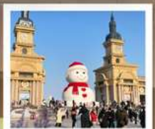
ตุ๊กตาคือ: ยักษ์