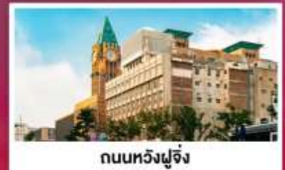
ถนนหวังฝูจิ่ง