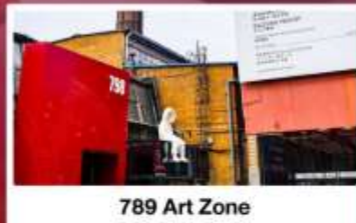
789 Art Zone