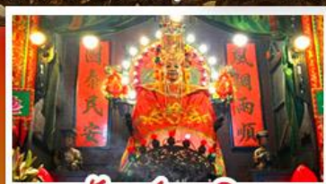
วัดเซกตงเหมียว