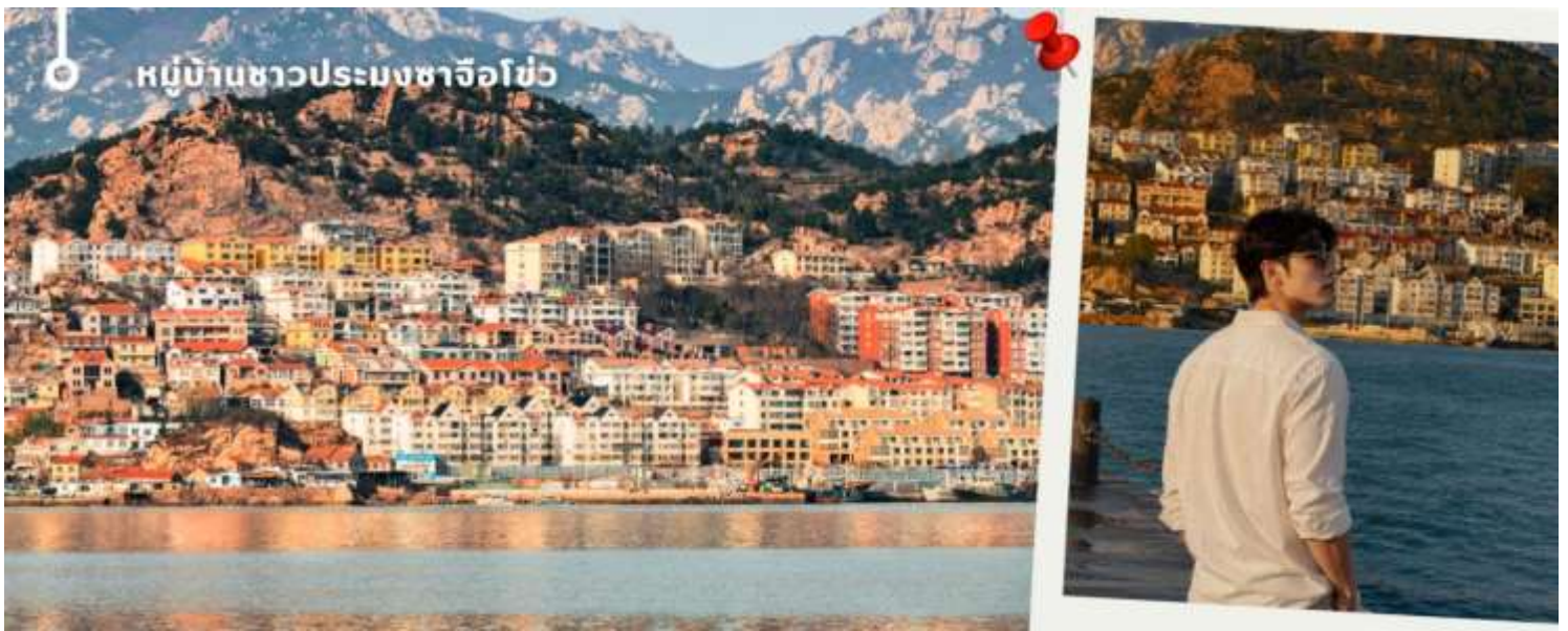
หมู่บ้านชาวประมงชาวจี๋โจว

เจียบสงบของภูเขาและทะเล พร้อมเลือกซื้ออาหารทะเลสดใหม่ และเก็บภาพความประทับใจกับหนึ่งในแลนด์มาร์กยอดนิยมของชิงเต่า