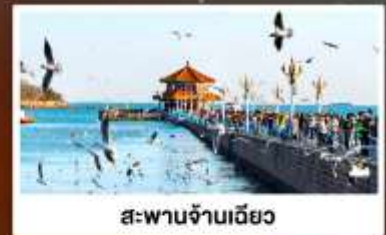
สะพานจ้านเฉียว