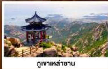
กุเจาเหลาชาน