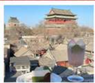
คาเฟ่ น้ำตาล