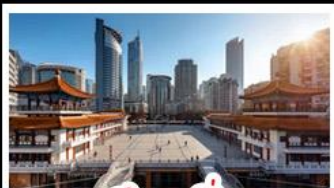
ตึกขุยซิง

พระแกะสลักหินต้าจู้ - หลุมฟ้าสะพานสวรรค์ - เจานางฟ้า ตึกขุยซิง - ตึกตะเกียบ - หมู่บ้านโบราณฉือซีโจว