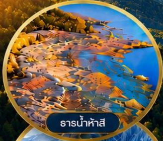
ธารน้ำห้ำสี่