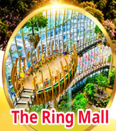
The Ring Mall