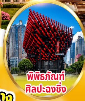
พิพิธภัณฑ์ ศิลปะฉงชิ่ง