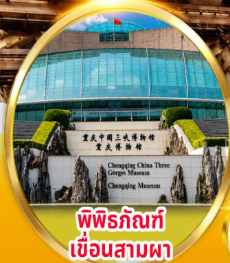
พิพิธภัณฑ์ เขื่อนสามผา