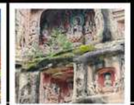
หินแกะสลักหนานคาน

PERIOD 1 : 13 - 17 ต.ค. 2569 PERIOD 2 : 17 - 21 ต.ค. 2569