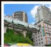
รถไฟกะลุดัก

ภูเขาควงอู๋ซาน (รวมกระเช้า) • อุทยานหมีเขาสาน หินแกะสลักหนานคาน • ชมรถไฟกะลุดัก หงหยาดัง • ถนนคนเดินเจียฟางเป่ย์