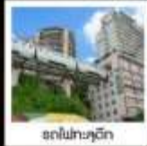
ฮอเทลในฉงชิ่ง