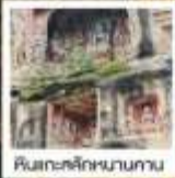
ริวเกะสัถกหนานกาน