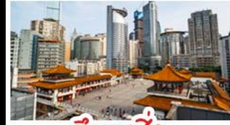
ตึกขุยซิง

พระแกะสลักหินต้าจู้ - หลุมฟ้าสะพานสวรรค์ - เขานางฟ้า ตึกขุยซิง - ตึกตะเกียบ หมู่บ้านโบราณฉือซีไห่