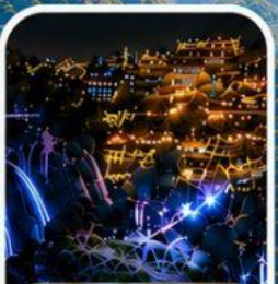
เมืองโบราณฟูหรงเจิ้น หมู่บ้านโบราณกลางหุบเขา