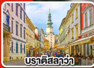
ปราติสลาวา

เที่ยวเมือง คาร์โลวารี เมืองแห่งสปา พร้อมเมนูพิเศษเปิดโบฮีเมีย