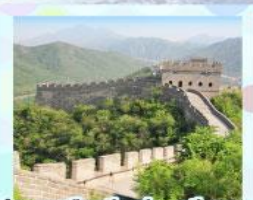
กำแพงเมืองจีน ด้านจวิยงกวน