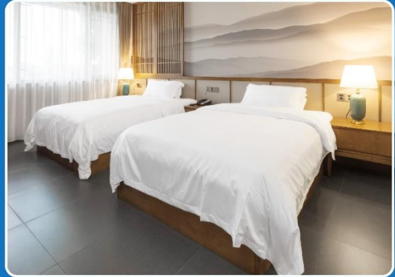
👤👤 TWIN (TWN)