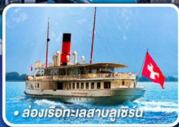
• ล่องเรือทะเลสาบลูซิร์น